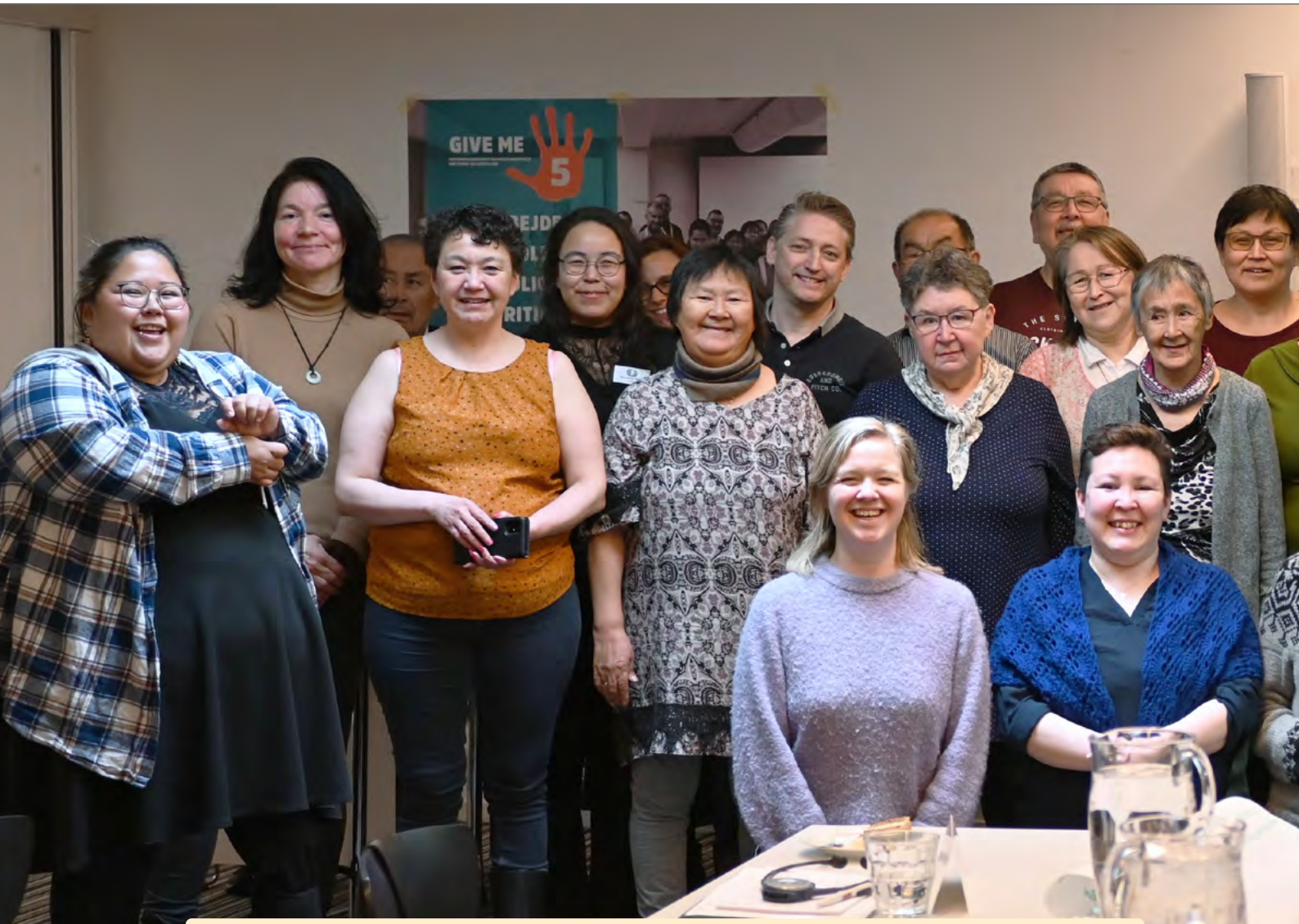
Medlemmer af handicapforeningerne fra hele kysten satte dagsordenen for konferencen og hvordan man gennem investeringer kan skabe bæredygtige initiativer til gavn for personer med handicap og hele samfundet.

Netop ved at tænke på tværs af målene og se dem som en helhed, kan vi sikre en udvikling imod en bæredygtig fremtid, hvor personer med handicap er inkluderet og kan bidrage til samfundets udvikling. Verdensmålene er derfor et redskab til at tænke innovativt og i investeringer, som gavner ikke kun personer med handicap - men hele verden. For løsninger på handicapområdet gavner hele samfundet.